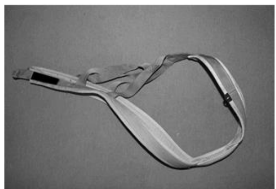
Figura 3 Imbrago